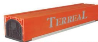
CAIXA DE PERSIANA