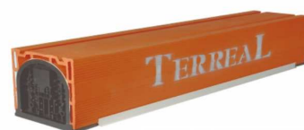
CAIXA DE PERSIANA