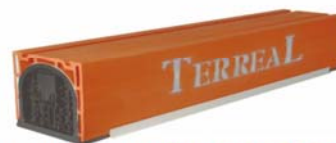
CAIXA DE PERSIANA